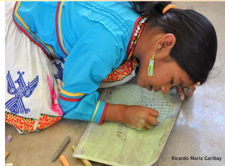
Ricardo María Garibay